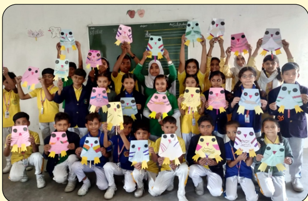
PICTURE OF ACTIVITY