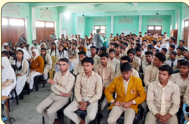
STUDENT DURING THE COUNSELLING