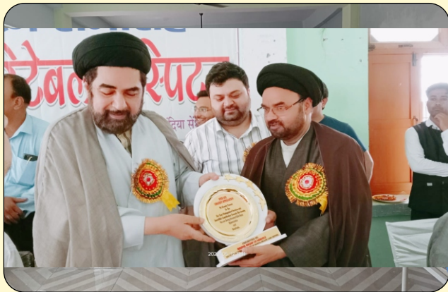
INAUGRATION OF HOSPITAL