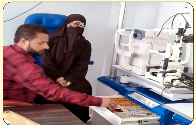
EYE TESTING OF PATIENTS