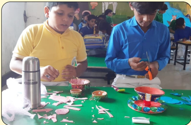
ACTIVITY OF DIYA MAKING