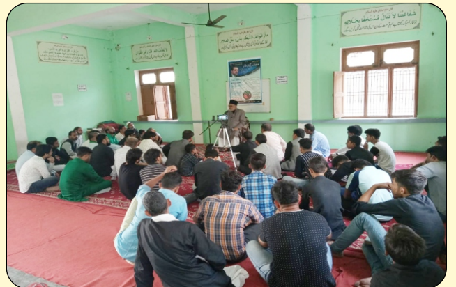
LISANUL WAIZEN IN THE CONDULANCE OF MOHIB NASIR MARHOOM