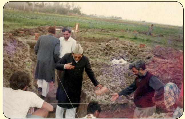
STONE LAYING CEREMONY