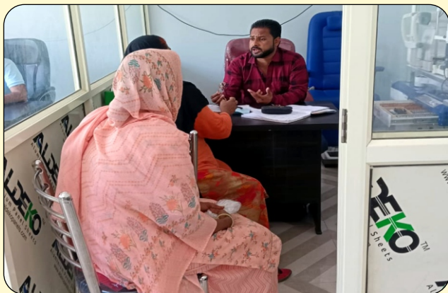
TREATMENT OF PATIENTS