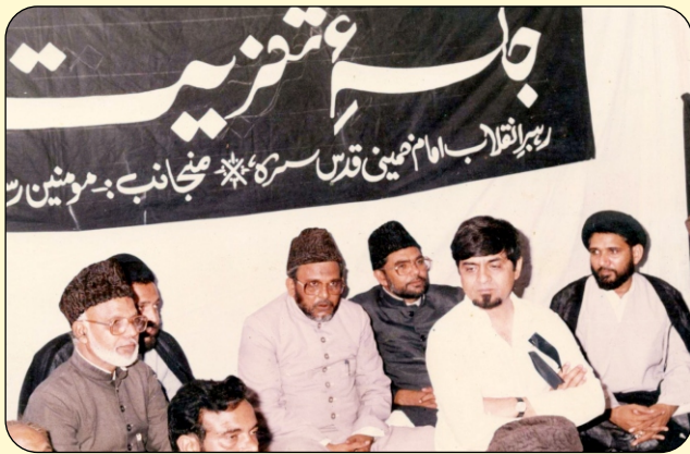
LISANUL WAIZEN IN THE CONDULANCE OF IMAM KHUMAINI