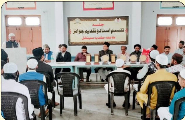
PRIZE DISTRIBUTION OF JAMA-E-MEHDIA