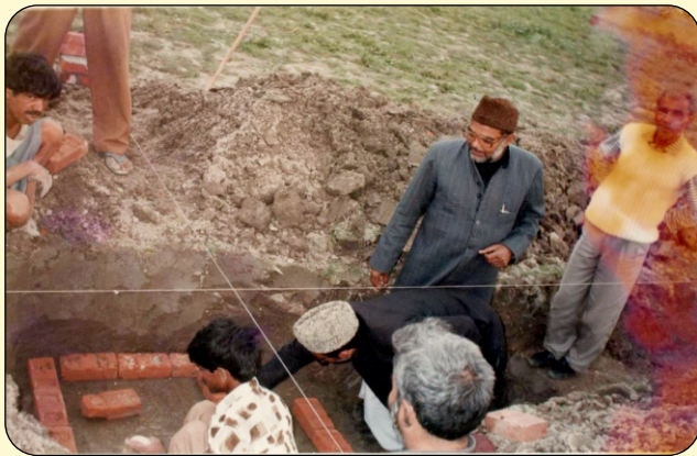
STONE LAYING CEREMONY