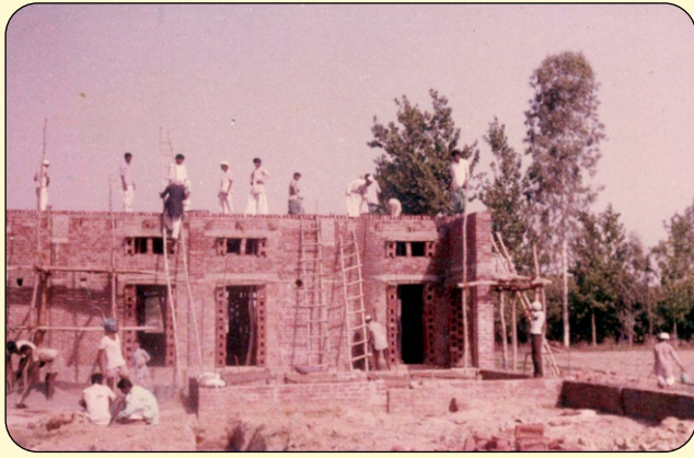
PICTURE OF COSTRUCTION OF JAMA-E-MEHDIA