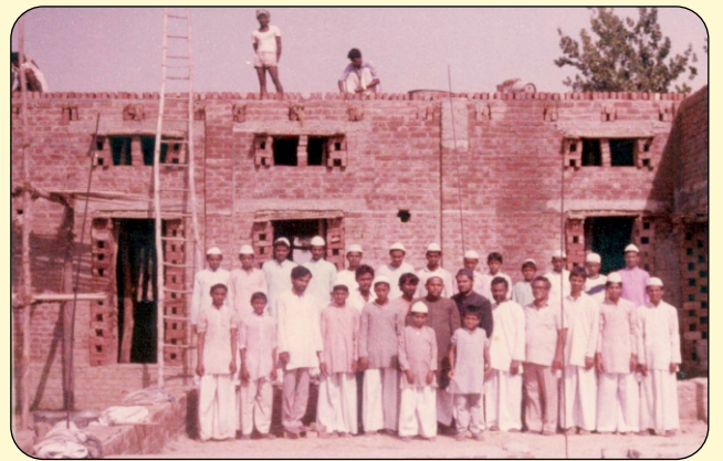
TEACHERS, STUDENTS OF JAMA-E-MEHDIA