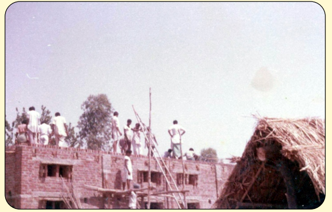
PICTURE OF COSTRUCTION OF JAMA-E-MEHDIA