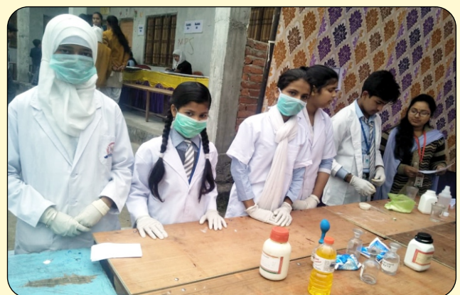
SCIENCE ACTIVITY BY INTER COLLEGE STUDENT