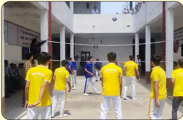
STUDENTS PLAYING GAME