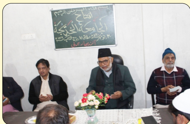
TEACHERS DURING DUA