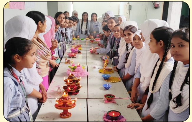
DIYA MAKING COMPETITION