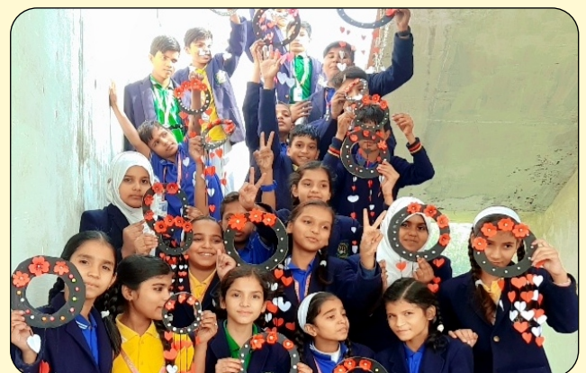
PICTURE OF ACTIVITY