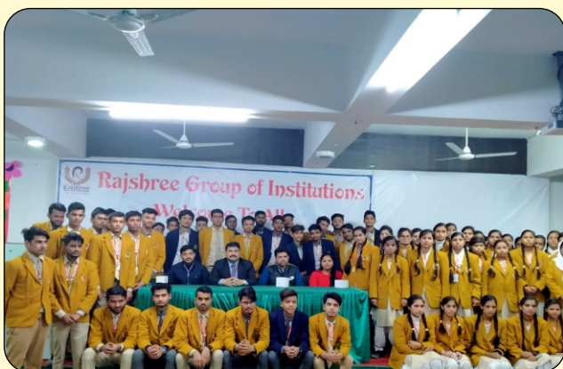
STUDENT OF INTER COLLEGE