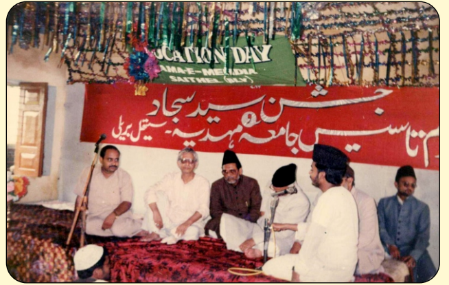
CELEBRATION OF JASHNE SYED-E-SAJJAD