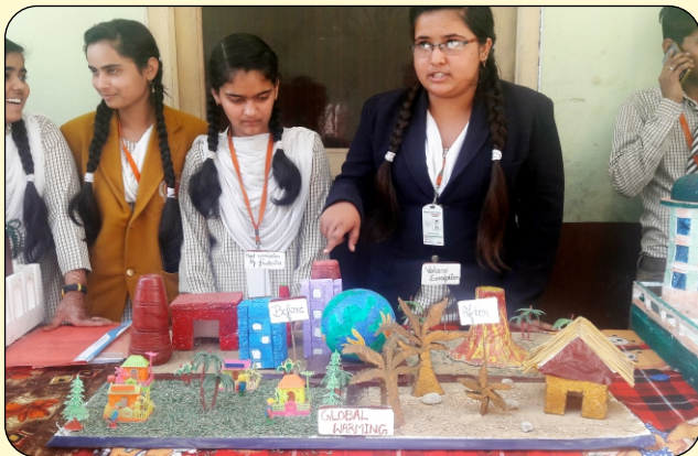
SCIENCEKIT MADEBY STUDENT