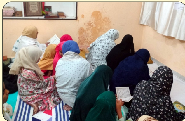
STUDENT RECEIVING THE EDUCATION