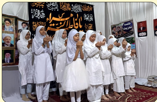
STUDENT DURING THE PRAYER