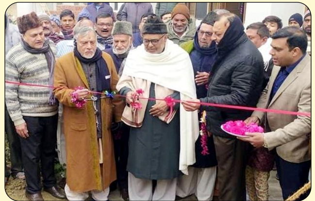
INUNGRATION OF HOSPITAL