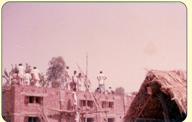
CONTINUATION OF COSTRUCTION