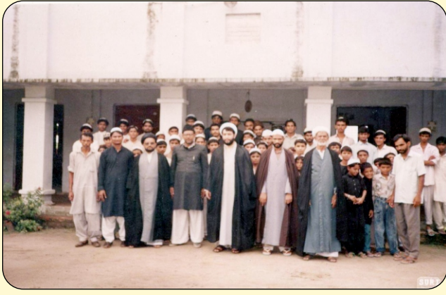
TEACHERS STUDENTS OF JAMA-E-MEHDIA