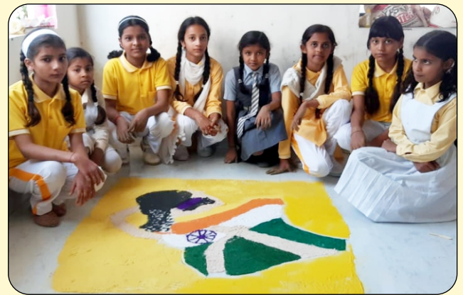
ACTIVITY OF RANGOLI